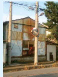
青柳8丁目地内 他多数