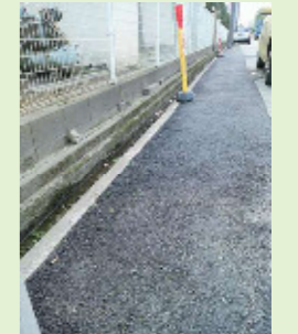
補修及び側溝清掃