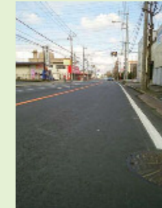
通行中の方より轍がひどくバイクが転倒しそうになった。とのご要望をいただき、草加市建設部より県土木事務所へ通報していただき補修