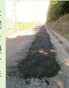
担当課により一旦補修しましたが再度凹み、本年度予算にて対応予定です

道路の補修のご要望も多数お寄せいただきました。ミラー同様、通行中に市民の方が危険個所に気づかれ、ご意見をいただいています。補修は、生活道路優先であったり、予算の面で遅々として進まない箇所もあります。ご理解のほどお願い申し上げます。