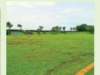
松伏グランド(イメージ)

この他にもたくさんのご要望や、ご意見をいただきました。ありがとうございます。また議会でも皆様のご意見を反映すべく取り上げさせていただきますので、日々の暮らしの中で感じたことや、気がついたことがございましたらお気軽にお声がけ下さい。