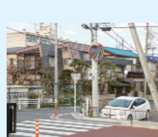
八幡北小学校付近 草幡橋

昨年度お寄せいただいたご要望が多かったのがミラーの設置でした。普段何気なく通っている道も、ご近所の方の普段の生活の中での視線で危険個所が発見され、安全な道になっていきます。ありがとうございます。