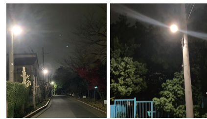
川柳中 万葉の道 青徳幼稚園 南門付近