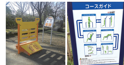
そうか公園 柿木フーズサイト公園

平成27年12月議会ですうか公園等への健康づくり器具設置について質問。以降、そうか公園等へ順次設置されるようになりました。