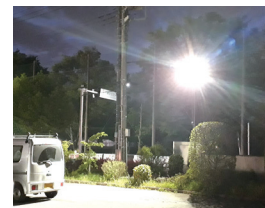
川柳文化センター